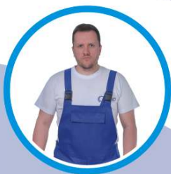
ЛЕТНЯЯ РАБОЧАЯ ОДЕЖДА