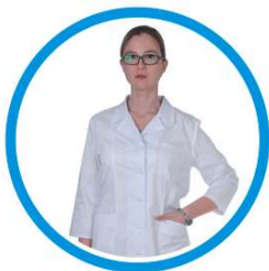
ОДЕЖДА ДЛЯ СЕРВИСНЫХ И МЕДИЦИНСКИХ РАБОТНИКОВ