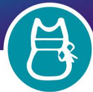
ХИТОН (ФАРТУК) РАБОЧИЙ