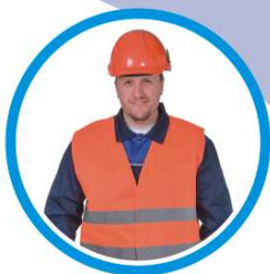
СИГНАЛЬНАЯ РАБОЧАЯ ОДЕЖДА