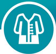
ХАЛАТ РАБОЧИЙ КЛАССИЧЕСКИЙ